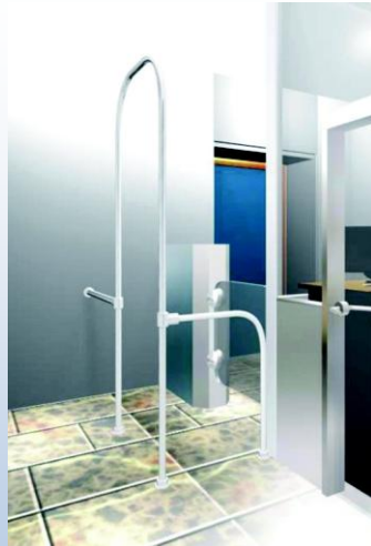
FRACTAL-01/12 Diseño individual